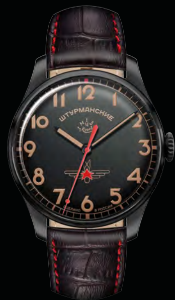
РЕФ. 2609/3714129 КОРПУС ТИТАН С ПОКРЫТИЕМ ЧЕРНЫЙ PVD ЦИФЕРБЛАТ ЧЕРНЫЙ С ЛЮМИНЕСЦЕНТНЫМИ ИНДЕКСАМИ РЕМЕШОК КОЖА, ЧЕРНЫЙ