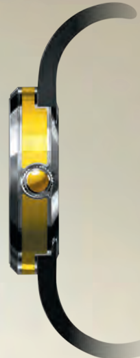
РЕФ. 9015/1871999 КОРПУС НЕРЖАВЕЮЩАЯ СТАЛЬ С ЭМАЛЬЮ РУЧНОЙ РАБОТЫ ЦИФЕРБЛАТ ЧЕРНЫЙ С ОТДЕЛКОЙ АЛМАЗНОЙ ГРАНЬЮ РЕМЕШОК КОЖА