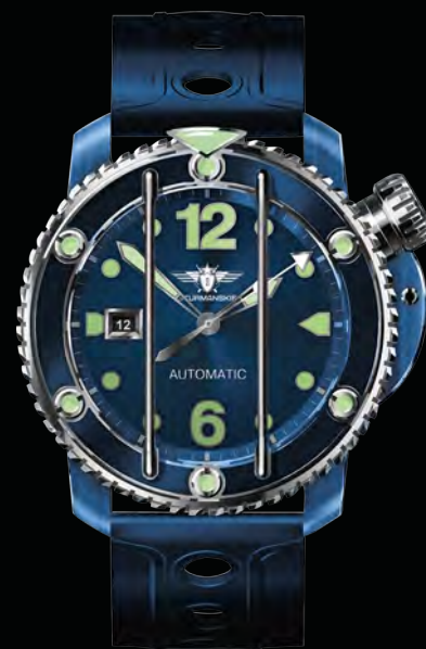
РЕФ. NH35/1822944 КОРПУС НЕРЖАВЕЮЩАЯ СТАЛЬ С PVD ЦИФЕРБЛАТ СИНИЙ С ЛЮМИНЕСЦЕНТНЫМИ ИНДЕКСАМИ РЕМЕШОК СИЛИКОНОВЫЙ И КОЖАНЫЙ