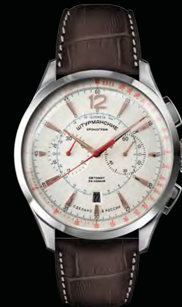
РЕФ. NE86/1855018 КОРПУС НЕРЖАВЕЮЩАЯ СТАЛЬ ЦИФЕРБЛАТ БЕЖЕВЫЙ С ЗОЛ. ЗНАКАМИ РЕМЕШОК КОЖА, КОРИЧНЕВЫЙ