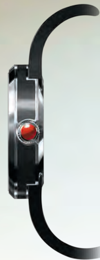
РЕФ. 9015/1871777 КОРПУС НЕРЖАВЕЮЩАЯ СТАЛЬ С ЭМАЛЬЮ РУЧНОЙ РАБОТЫ ЦИФЕРБЛАТ ЧЕРНЫЙ С ОТДЕЛКОЙ АЛМАЗНОЙ ГРАНЬЮ РЕМЕШОК КОЖА