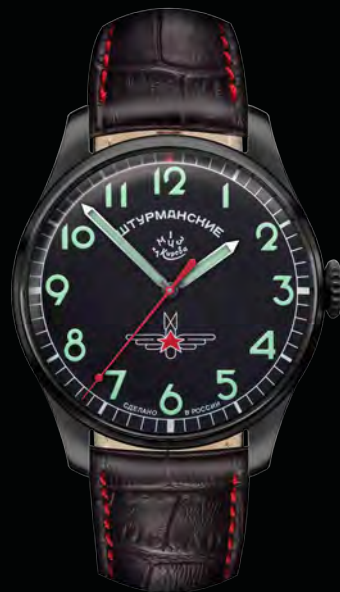
РЕФ. 2609/3714130 КОРПУС ТИТАН С ПОКРЫТИЕМ ЧЕРНЫЙ PVD ЦИФЕРБЛАТ ЧЕРНЫЙ С ЛЮМИНЕСЦЕНТНЫМИ ИНДЕКСАМИ РЕМЕШОК КОЖА, ТЕМНО-КОРИЧНЕВЫЙ