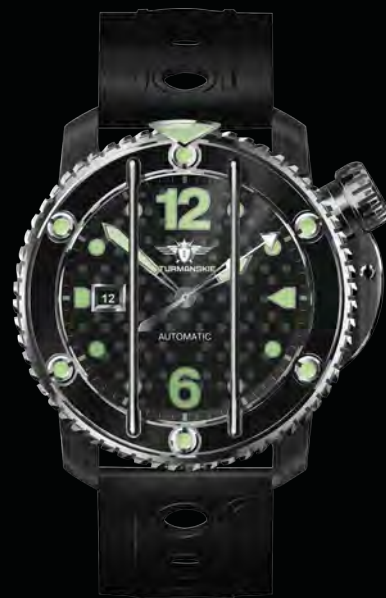
РЕФ. NH35/1824895 КОРПУС НЕРЖАВЕЮЩАЯ СТАЛЬ С PVD ЦИФЕРБЛАТ ЧЕРНЫЙ С ЛЮМИНЕСЦЕНТНЫМИ ИНДЕКСАМИ РЕМЕШОК СИЛИКОНОВЫЙ И КОЖАНЫЙ