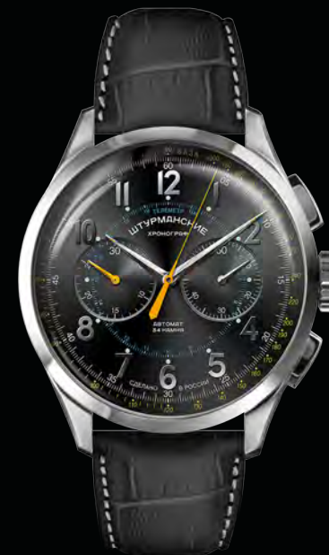
РЕФ. NE86/1855015 КОРПУС НЕРЖАВЕЮЩАЯ СТАЛЬ ЦИФЕРБЛАТ ЧЕРНЫЙ С НАКЛАДНЫМИ ЗНАКАМИ РЕМЕШОК КОЖА, ЧЕРНЫЙ