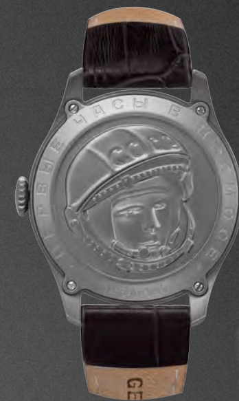
ЗАДНЯЯ КРЫШКА С РЕЛЬЕФНЫМ ПОРТРЕТОМ ЮРИЯ ГАГАРИНА