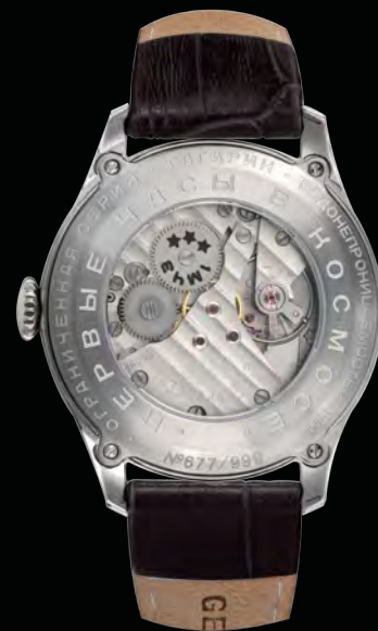
ЗАДНЯЯ КРЫШКА СО СТЕКЛОМ