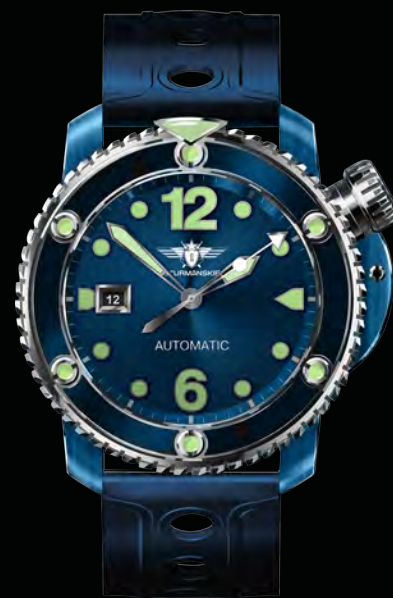
РЕФ. NH35/1822944 КОРПУС НЕРЖАВЕЮЩАЯ СТАЛЬ С PVD ЦИФЕРБЛАТ СИНИЙ С ЛЮМИНЕСЦЕНТНЫМИ ИНДЕКСАМИ РЕМЕШОК СИЛИКОНОВЫЙ И КОЖАНЫЙ