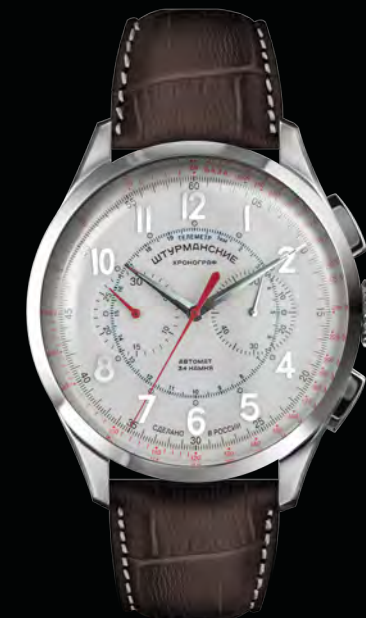
РЕФ. NE86/1855016 КОРПУС НЕРЖАВЕЮЩАЯ СТАЛЬ ЦИФЕРБЛАТ СЕРЕБРИСТО-СЕРЫЙ С НАКЛАДНЫМИ ЗНАКАМИ РЕМЕШОК КОЖА, КОРИЧНЕВЫЙ