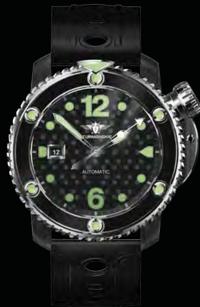
РЕФ. NH35/1824893 КОРПУС НЕРЖАВЕЮЩАЯ СТАЛЬ С PVD ЦИФЕРБЛАТ ЧЕРНЫЙ С ЛЮМИНЕСЦЕНТНЫМИ ИНДЕКСАМИ РЕМЕШОК СИЛИКОНОВЫЙ И КОЖАНЫЙ